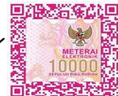
Rangga Timur Aryaputra