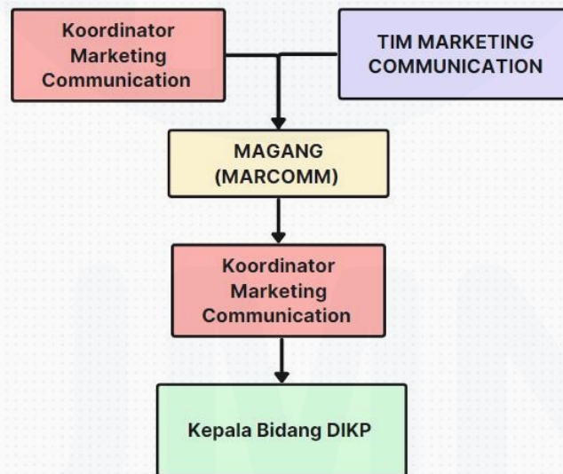
Gambar 2. 4 Bagan alur kerja & alur koordinasi tugas utama

Pelaksanaan kerja magang yang dilaksanakan secara langsung oleh Muhammad Farhan Putra Atmaja selaku penulis di Pusat Pemerintahan Kota Tangerang bagian Dinas Komunikasi dan Informatika Kota Tangerang, yang menempatkan posisi sebagai Intern Marketing Communication Team dan menjalankan tugas utama melakukan monitoring pemberitaan atau media monitoring , berikut merupakan bagan alur kerja dan alur koordinasi dari tugas utama yang dilakukan oleh penulis.