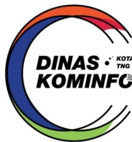
Gambar 2. 1 Logo Diskominfo Kota Tangerang (Tangerangkota, 2022)