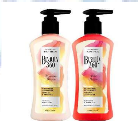
Gambar 2.3 Varian Body Serum Beauty 360