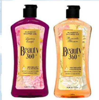
Gambar 2.2 Varian Body Wash Beauty 360