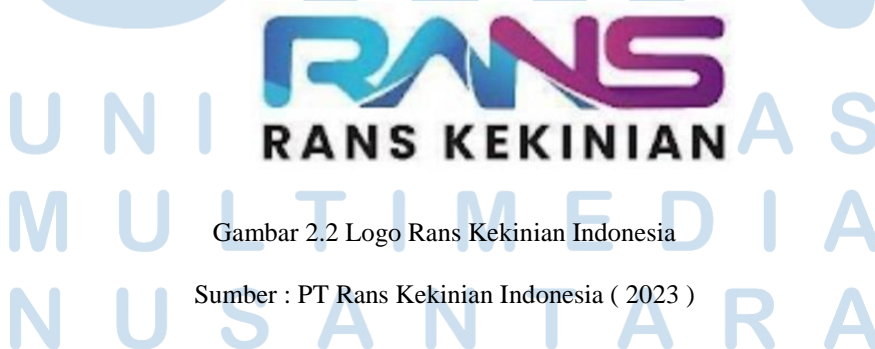
Gambar 2.2 Logo Rans Kekinian Indonesia

Toko Mama Gigi by Nagita Slavina merupakan tempat dimana penulis melakukan praktik kerja magang. Dari sekian banyak bisnis yang dihadirkan oleh Rans Entertainment dan anak perusahaannya, dalam upaya memperluas jangkauan bisnis mereka mencoba merambah ke industri Live Stream E-commerce , salah satunya adalah dengan menghadirkan Toko Mama Gigi by Nagita Slavina yang berada di bawah naungan PT Rans Kekinian Indonesia.