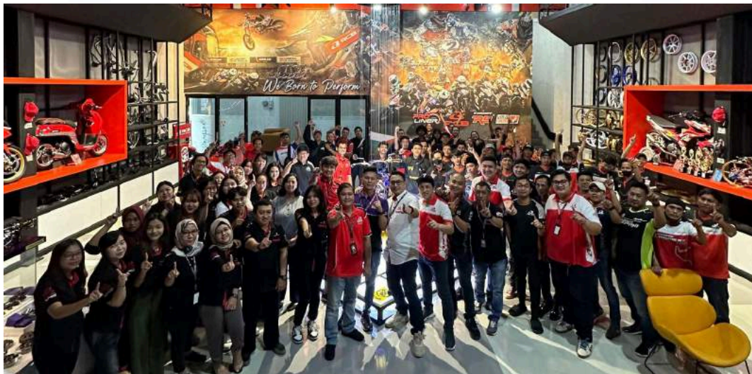
Gambar 2.2 Foto Bersama PT Enwan Multi Partindo

Kini PT Enwan Multi Partindo sudah berdiri selama 18 tahun memproduksi dan menyalurkan produk-produk aksesoris motor berkualitas kepada konsumennya. Distribusi produk dilakukan melalui berbagai platform, terutama melalui kerja sama dengan mitra toko aksesoris motor di berbagai kota di Indonesia. Selain itu, produk-produk aksesoris motor dari brand-brand tersebut juga dapat diakses konsumen melalui e-commerce , seperti Tokopedia dan Shopee. PT Enwan Multi Partindo juga aktif mengikuti berbagai event otomotif dan bekerja sama dengan KOL untuk memperluas awareness akan brand-brand naungannya.