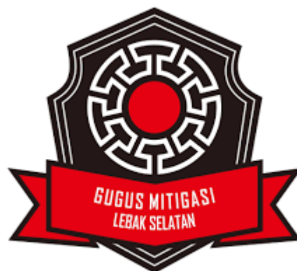
Gambar 2. 1 Logo Gugus Mitigasi Lebak Selatan

Komunitas Gugus Mitigasi Lebak Selatan atau secara singkat GMLS adalah sebuah komunitas yang termasuk organisasi non-profit yang fokus terhadap mitigasi bencana dan berpusat di Lebak Selatan. Komunitas ini didirikan pada 13 Oktober 2020 oleh masyarakat dan Anis Faisal Reza sebagai Ketua dari Gugus Mitigasi Lebak Selatan atau yang akrab disapa sebagai Abah Lala. Berawal dari inisiatif dan dukungan masyarakat untuk penyebaran informasi serta advokasi mengenai isu kebencanaan, GMLS bertujuan untuk membangun masyarakat yang siap siaga dan teredukasi mengenai potensi bencana di Lebak Selatan. Dalam artikel berita TrustBanten disebutkan bahwa saat ini anggota Gugus Mitigasi Lebak Selatan berjumlah delapan orang dengan latar belakang yang berbeda-beda (Mamora, 2023).