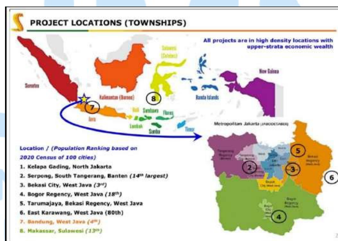
Gambar 2.3 Peta Proyek PT Summarecon Agung Tbk

Unit bisnis PT Summarecon Agung Tbk terbagi menjadi tiga kegiatan utama, yaitu pengembangan properti, investasi, manajemen properti, rekreasi, hospitality, dan lain-lain. Seiring perkembangan perusahaan, PT Summarecon Agung Tbk juga menyediakan layanan di bidang lain, seperti pendidikan dan olahraga. Keberadaan PT Summarecon Agung Tbk terasa di berbagai wilayah di Indonesia, yang tergambar dalam peta penyebarannya pada gambar yang terlampir.