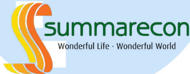
Gambar 2.1 Logo Summarecon

PT Summarecon Agung Tbk, sebuah perusahaan pengembang real estat yang berlokasi di Jalan Perintis Kemerdekaan, No. 42, Jakarta Timur, dikenal dengan tagline "Wonderful Life Wonderful World." Hal ini mencerminkan komitmen perusahaan untuk terus maju dalam menciptakan kehidupan yang indah dan dunia yang memikat bagi semua orang.