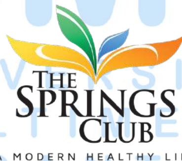
Gambar 2.2 Logo The Springs Club

Perusahaan ini juga memiliki divisi yang fokus pada bidang jasa dan rekreasi, yang dikenal sebagai The Springs Club. The Springs Club merupakan sebuah klub olahraga yang memberikan layanan terbaik kepada anggotanya, dilengkapi dengan ballroom ( banquet ) berkapasitas lebih dari 1.200 orang. Logo resmi dari The Springs Club mencerminkan semangat dan dedikasi dalam menyediakan pengalaman yang luar biasa bagi para anggota.