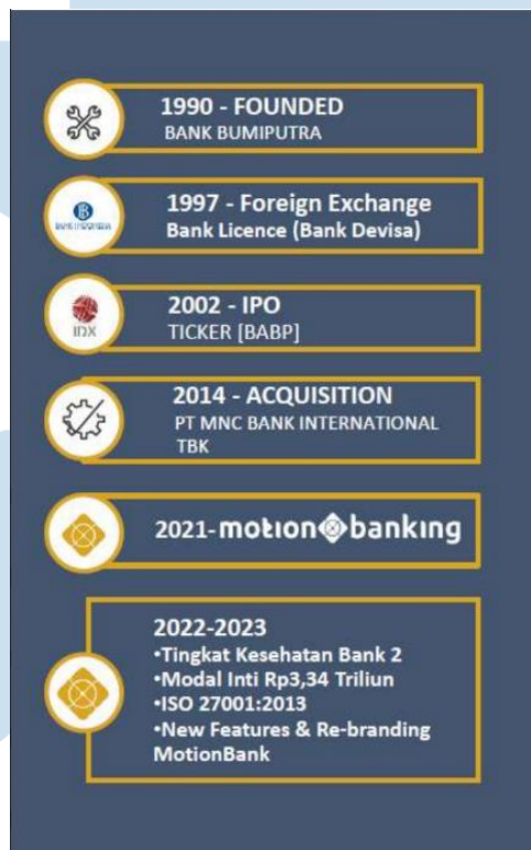
Gambar 2.1 Sejarah PT. Bank MNC International Tbk

PT. Bank MNC International Tbk merupakan bank swasta nasional yang berdiri dengan nama PT Bank Bumiputera pada 9 Agustus 1989. PT. Bank MNC International Tbk resmi beroperasi pada 12 Januari 1990 dengan nama PT Bank Bumiputera. Pada tahun 1997, PT. Bank MNC International Tbk mendapat persetujuan untuk menjadi Bank Devisa dari Bank Indonesia. Pada tahun 2002, PT. Bank MNC International Tbk resmi mencatatkan sahamnya sebagai perusahaan terbuka di Bursa Efek Indonesia.