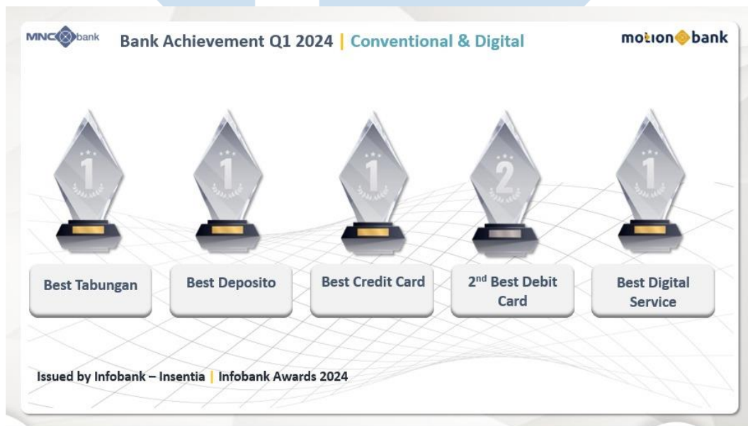
Gambar 2.2 Penghargaan Q1 2024

MNC Bank menawarkan produk dan jasa perbankan antara lain produk simpanan, fasilitas pinjaman, kartu debit dan kredit, treasury , dan trade finance . PT Bank MNC International Tbk juga meluncurkan layanan mobile dan internet banking pada 2021 yang disebut dengan motion banking .