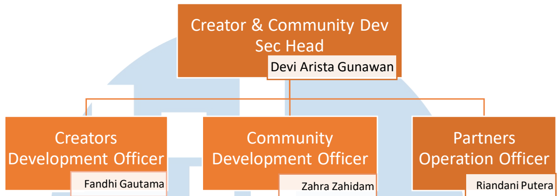
Gambar 2. 3 Struktur Creators & Community Development