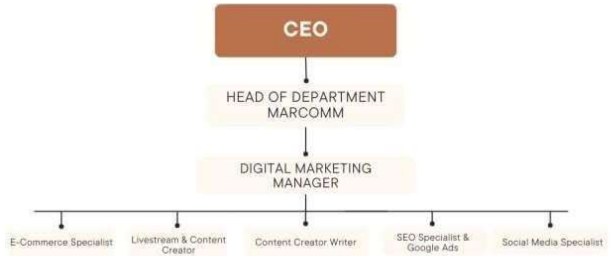
Gambar 2.2 Struktur Divisi Digital Marketing PT. Passion Abadi Korpora

Dalam menjalankan kegiatan Perusahaan dengan baik, dibutuhkan anggota organisasi yang dapat menjalankan tugas, dapat berkomunikasi dan berkoordinasidengan baik. Berikut merupakan rincian tugas dan tanggung jawab dari bagian Digital Marketing :