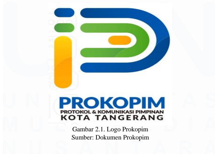
Gambar 2.1. Logo Prokopim