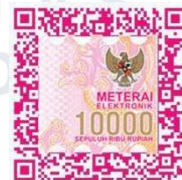
(Alivia Syaidha Nur Syava)