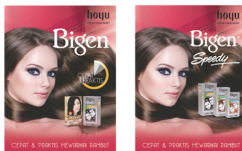
Gambar 3.3 Alternatif Desain 2

Gambar 3.2 dan Gambar 3.3 merupakan alternatif desain yang awalnya diberikan kepada klien, namun pada saat itu klien masih belum puas dengan