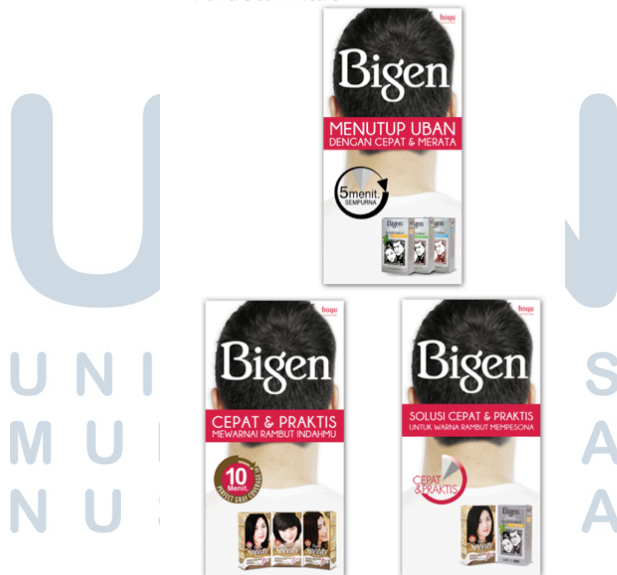
Gambar 3.7 Desain Billboard Bigen Vertikal Male