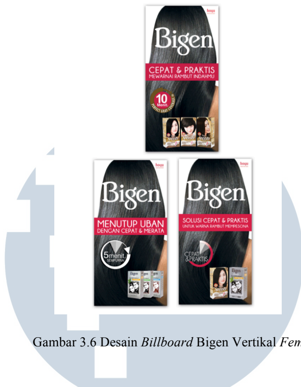
Gambar 3.6 Desain Billboard Bigen Vertikal Female