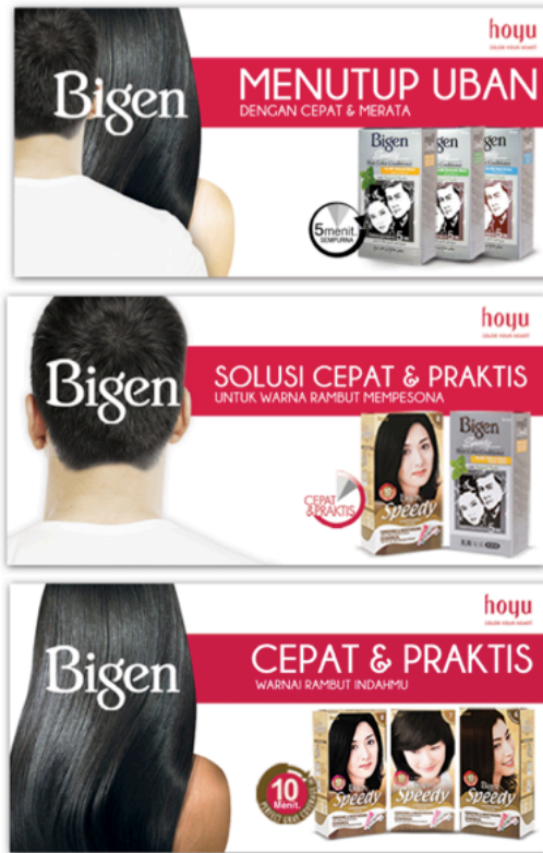
Gambar 3.8 Desain Billboard Bigen Horizontal

Pada gambar 3.6, 3.7, dan 3.8 adalah gambar desain billboard yang layout -nya sudah disetujui oleh klien dan kemudian akan dikerjakan oleh bagian studio untuk diubah menjadi high resolution . Pada hal ini, seorang art director yang membuat desain hingga layout masih dalam bentuk low resolution yang telah disetujui yang kemudian akan di serahkan ke bagian studio untuk mendapatkan hasil yang high resolution lalu dapat dicetak dalam ukuran besar yakni dengan ukuran billboard 5 x 10 m.