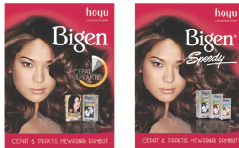
Gambar 3.2 Alternatif Desain 1