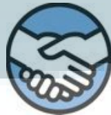
Gambar 2.6 Simbol Customer Delight

CUSTOMER DELIGHT , memiliki simbol dua buah tangan bersalaman erat, senang bersama. Costumer delight merupakan representasi dari tersedianya layanan dan produk berkualitas sesuai permintaan pelanggan Kompas Gramedia, mempelajari kebutuhan yang dikehendaki pelanggan, memberikan kemudahan demi pelanggan, menangani keluhan dan masalah pelanggan secara profesional, mengusahakan pelanggan lebih terdidik dan lebih terlayani kebutuhannya.