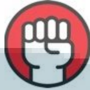
Gambar 2.5 Simbol dari Competitive

CUSTOMER DELIGHT , memiliki simbol dua buah tangan bersalaman erat, senang bersama. Costumer delight merupakan representasi dari tersedianya layanan dan produk berkualitas sesuai permintaan pelanggan Kompas Gramedia, mempelajari kebutuhan yang dikehendaki pelanggan, memberikan kemudahan demi pelanggan, menangani keluhan dan masalah pelanggan secara profesional, mengusahakan pelanggan lebih terdidik dan lebih terlayani kebutuhannya.