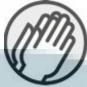
Gambar 2.3 Simbol visual dari Credible

COMPETENT , memiliki simbol tangan sebelah kanan mengacungkan ibu jarinya. Simbol yang juga menggambarkan sikap setuju dan hebat. Competent merepresentasikan sikap profesional, dapat beradaptasi dan melakukan pekerjaan dengan hasil terbaik, menggunakan keberadaan sumberdaya secara efisien, efektif dan optimal serta dapat mengambil keputusan dengan arif dan bijaksana.