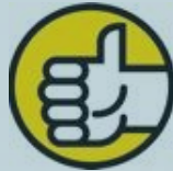
Gambar 2.4 Simbol dari Competent

COMPETENT , memiliki simbol tangan sebelah kanan mengacungkan ibu jarinya. Simbol yang juga menggambarkan sikap setuju dan hebat. Competent merepresentasikan sikap profesional, dapat beradaptasi dan melakukan pekerjaan dengan hasil terbaik, menggunakan keberadaan sumberdaya secara efisien, efektif dan optimal serta dapat mengambil keputusan dengan arif dan bijaksana.