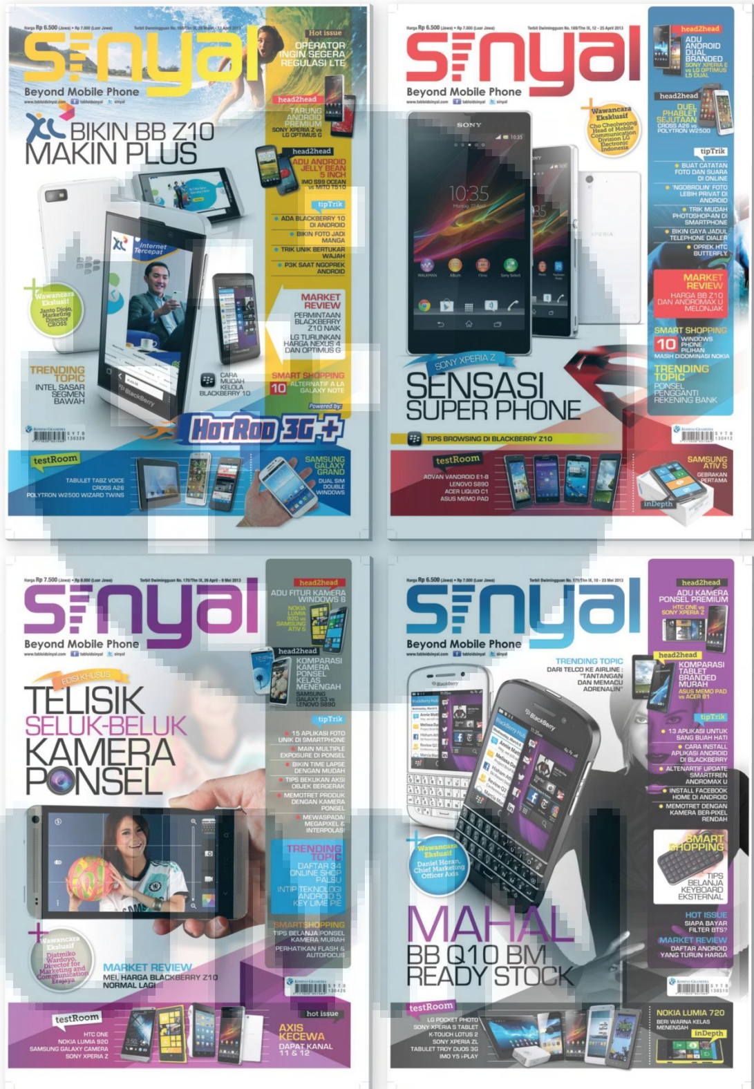
Gambar 2.11 Cover Tabloid Sinyal