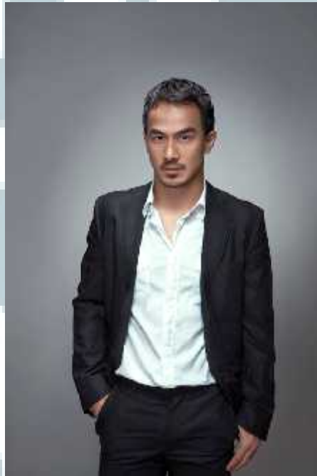
Gambar 2.6 Potrait Joe Taslim