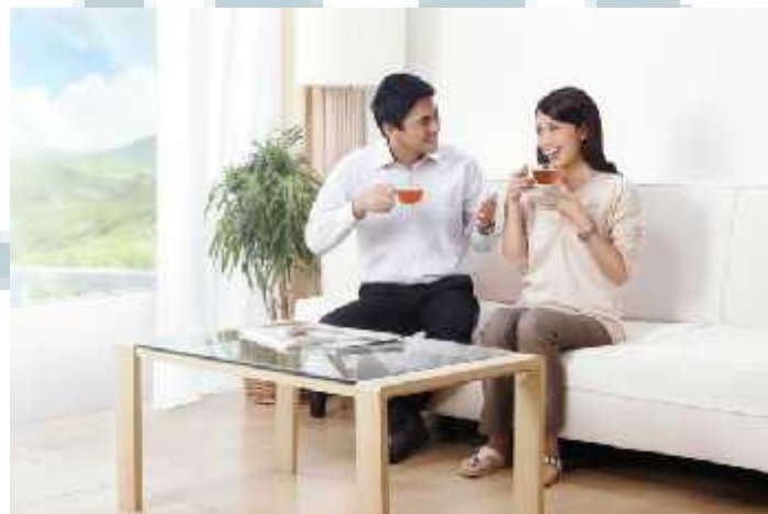
Gambar 2.4 Teh 2 Tang