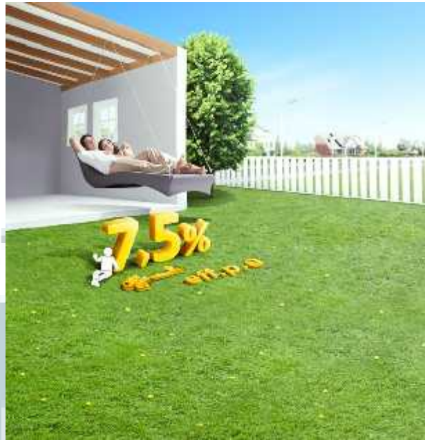
Gambar 2.2 BCA KPR KBB ( http://rizkiwahyudi.prosite.com/ )