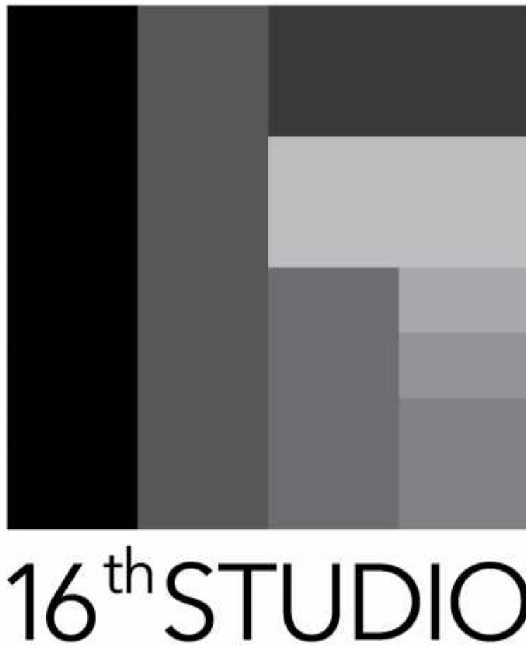
Gambar 2.1 Tampilan Logo 16 th Studio