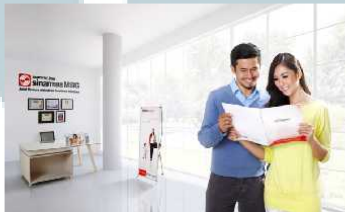
Gambar 2.3 Sinarmas MSIG ( http://rizkiwahyudi.prosite.com/ )