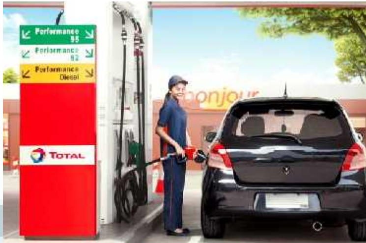
Gambar 2.5 TOTAL OIL ( http://rizkiwahyudi.prosite.com/ )