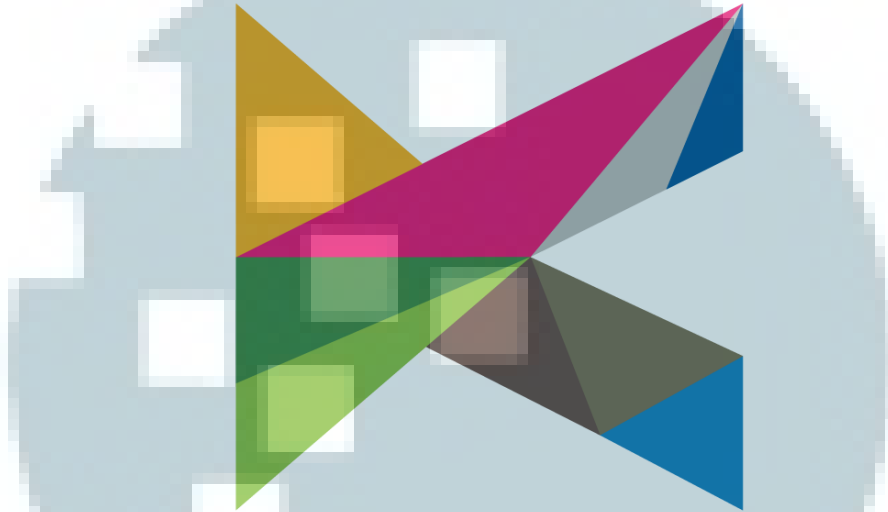
Gambar 2.1 Logo Kompas TV

BENTUK & WARNA → Logo menggambarkan INDONESIA yang terdiri dari unsur-unsur DARAT, LAUT, UDARA, dan MAKHLUK HIDUP yang ada di bumi Indonesia. Unsur-unsur Indonesia yang Bhinneka Tunggal Ika itu dicitrakan dalam unsur warna-warna yang diwakili oleh 9 WARNA. Masing-masing warna berada dalam bentuk SEGITIGA yang mengartikan energi, kekuatan, keseimbangan, hukum, ilmu pasti, agama, dan dinamis. Bentuk segitiga berwarna ini terintegrasi dalam bentuk mirip huruf K, inisial dari KOMPAS, melambangkan integrasi keragaman dan keutuhan sebagai inspirasi Indonesia.