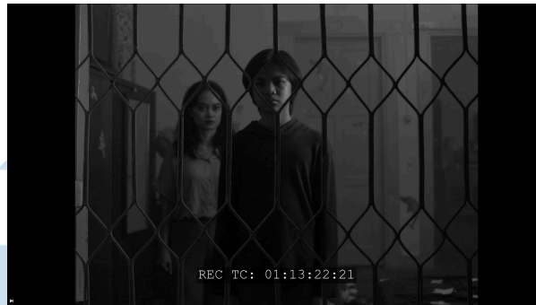
Gambar 4. Gambar ibu Raka menghantui Raka dari belakang