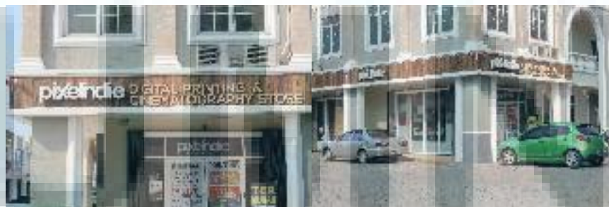
Gambar 2.1. Ruko Think Icon Pictures di lantai 3, Gading serpong.