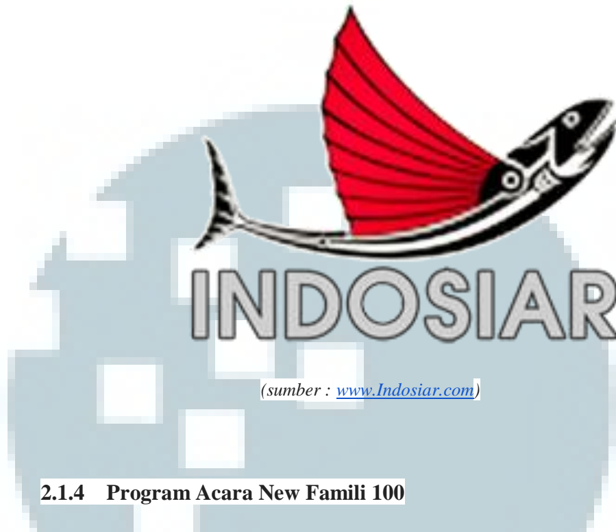
Gambar 2.2: Logo Indosiar Bentuk Ikan