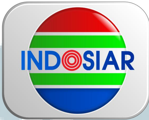
Gambar 2.1: Logo Indosiar