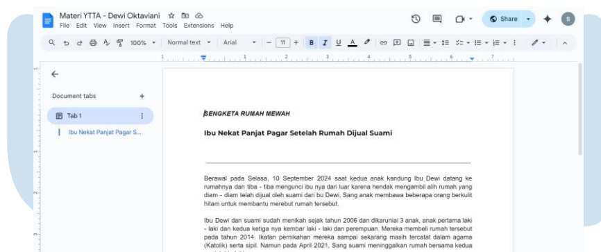
Gambar 3.2 Contoh Materi Riset Bintang Tamu (2024)