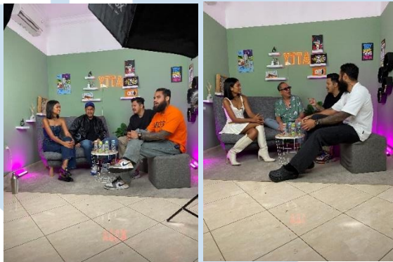
Gambar 3.5 Behind The Scene Shooting (2024)

Dalam tahap produksi, penulis bertanggung jawab menjadi talent koordinator. Penulis memastikan bintang tamu sampai sesuai dengan jadwal serta alamat yang ditentukan. Selain itu, penulis juga berperan menjadi time keeper dibelakang kamera agar durasi video yang dibuat tidak terlalu panjang. Selain itu, penulis juga menjadi quality control dari segi durasi serta materi yang sedang dibahas. Penulis akan melakukan cut setiap 20 menit take untuk melakukan quality control dan refresh materi bahasan kepada setiap host serta bintang tamu.