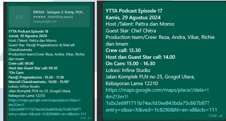
Gambar 3.3 Contoh Shooting Call (2024)

dan seluruh kru yang terlibat. Shooting call ini dikirim melalui Whatsapp baik secara pribadi maupun grup.