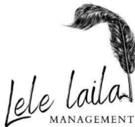
Gambar 2.1 Logo LeleLaila Management Sumber: LeleLaila Management (2024)