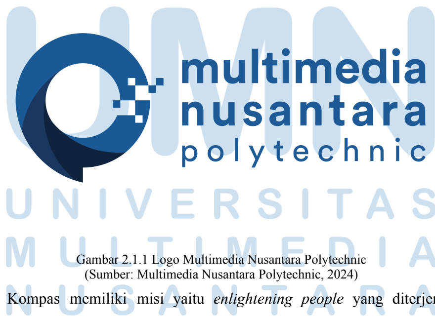
Gambar 2.1.1 Logo Multimedia Nusantara Polytechnic

MNP memiliki misi untuk membuat generasi bangsa yang lebih maju dengan kemampuan digital dan literasi yang baik melalui Tridharma pembelajaran perguruan tinggi yaitu menyelenggarakan pendidikan, penelitian, dan pengabdian kepada masyarakat bangsa. Selain itu MNP juga memiliki visi untuk menjadi politeknik dengan kualitas dunia yang dapat menciptakan dan membuat talenta yang unggul dan profesional di bidang kreatif berbasis teknologi (Multimedia Nusantara Polytechnic, 2024).