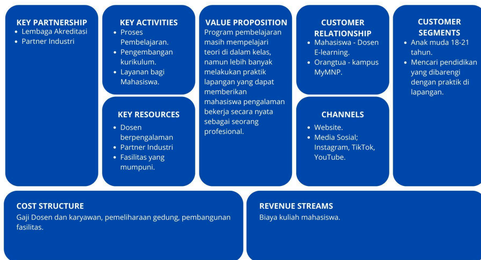
Gambar 2.1.2 Business Canvas Multimedia Nusantara Polytechnic