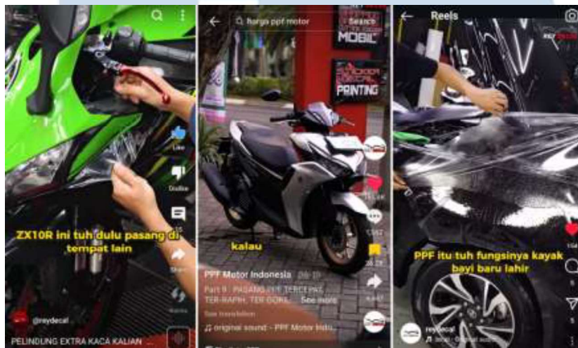
Gambar 3.2 Hasil Video yang Diunggah Lewat Media Sosial Reydecal

Penulis menggunakan kamera Sony A6400 untuk membuat semua video produk PPF yang diaplikasikan ke mobil atau motor pelanggan. Karena sebagian besar video akan diunggah ke media sosial seperti Tiktok, Instagram, dan YouTube Shorts, penulis membuat video yang bersifat vertikal dengan aspect ratio 9:16.