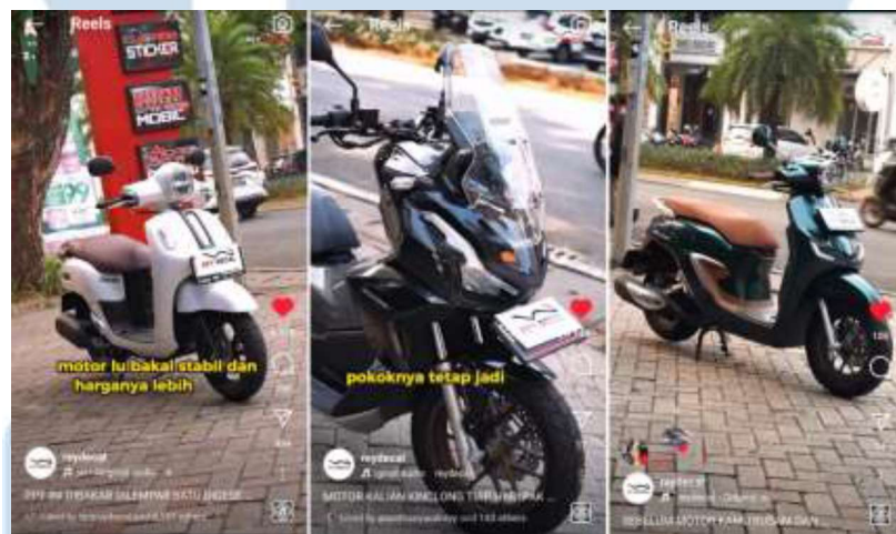
Gambar 3.4 Hasil Pemasangan Produk PPF

Ketika penulis sudah selesai merekam video pemasangan produk PPF, penulis langsung memindahkan file hasil video dari kamera ke laptop. Setelah itu file nantinya akan diberikan kepada editor yang dimana sebelum diberikan, penulis melakukan foldering sesuai dengan nama motor. Penulis juga terkadang ikut serta dalam proses editing .