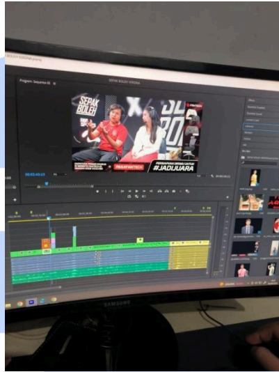
Gambar 3.4 Proses Editing “Sepak Boleh”

Acara “Lintas Melawai” berlangsung pada tanggal 11 Oktober hingga 13 Oktober. Selama berlangsung acara, penulis memiliki tugas yang beragam, mulai dari videographer untuk after movie Lintas Melawai, editing untuk recap day 1-2 Lintas Melawai, pemanggilan artis untuk dilaksanakan interview , dan juga offline editor after movie acara.