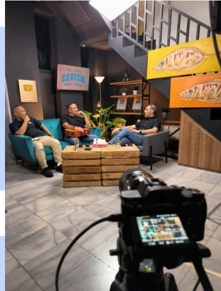
Gambar 3.3 Ruang Tengah R66 Media

Penulis sebagai editor memiliki satu program utama yang dipegang yaitu “Sepak Boleh”. Terkadang, apabila diminta, penulis juga membantu untuk mengedit program lainnya seperti “Hellow Yellow”. Untuk program-program tersebut, penulis diminta untuk mencari beberapa materi sendiri untuk bahan editan, meskipun sudah diberikan materi-materi utama yang harus dimasukkan. Contoh materi tambahan lainnya adalah foto atau video lucu, khususnya untuk program “Sepak Boleh” dan detail-detail berita untuk program “Hellow Yellow”.