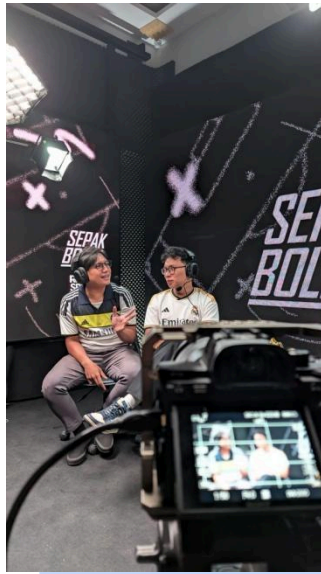
Gambar 3.2 Studio R66 Media