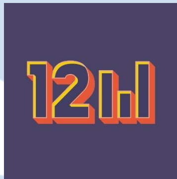
Gambar 2.1 Logo PT. Prema Gandharva Asia (12WIRED)