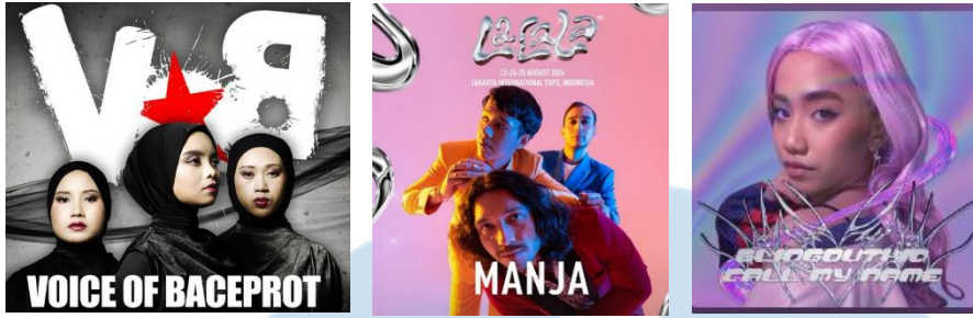
Gambar 2.2 Artist PT. Prema Gandharva Asia (12WIRED)

12WIRED didirikan pada masa pandemi di tahun 2020 yang dimana ini mengharuskan 12WIRED lebih memanfaatkan sosial media untuk mempromosikan musisi-musisi yang berada di naungan 12WIRED mulai dari konten video musik, konten sosial media dan sebagainya.