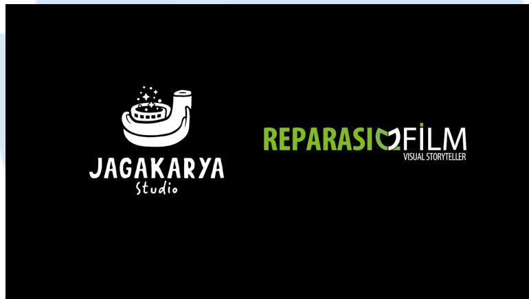
Gambar 2.1 Logo Jagakarya Studio X Reparasi Film