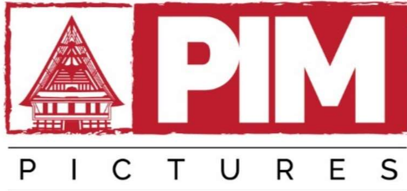
Gambar 2.1 Logo PT. Pariban Indo Media

PIM Pictures atau PT. Pariban Indo Media adalah sebuah rumah produksi film yang didirikan pada tahun 2018 oleh pak Agustinus Sitorus. Perusahaan ini dikelola oleh sekelompok pemuda Indonesia yang dinamis dan berfokus pada produksi media kontemporer, kreatif, dan bernilai. Dulunya, PIM Pictures berbasis di Jakarta, tetapi seiring berjalannya waktu, kini PIM Pictures berbasis di Depok, Jawa barat. PIM Pictures memproduksi berbagai jenis produk audio visual, mulai dari film, iklan televisi (TVC), video profil perusahaan, hingga iklan media sosial, dengan menyediakan layanan produksi high-end yang terjangkau untuk perusahaan dan organisasi lainnya.