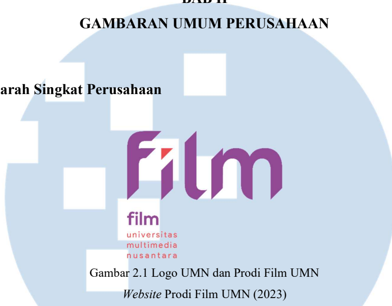
Gambar 2.1 Logo UMN dan Prodi Film UMN

Pada 20 November 2006, Universitas Multimedia Nusantara didirikan dengan empat fakultas, Fakultas Seni dan Desain, Fakultas Informasi dan Teknologi, Fakultas Ilmu Komunikasi, dan Fakultas Ekonomi. Pada tahun 2007, Program Studi Film hadir sebagai peminatan dalam jurusan Desain Komunikasi dan Visual. Program Studi Film awalnya hanya berfokus pada animasi saja. Fakultas Seni dan Desain kemudian mengembangkan sayapnya pada tahun 2008 dan meluncurkan peminatan Desain Komunikasi dan Visual yang baru yang bernama Sinematografi Digital.