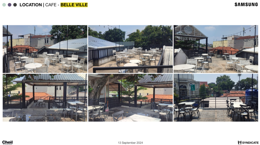
Gambar 3.2 Bagian Location dalam Deck

Setelah itu, penulis ditugaskan oleh Director dan Produser untuk mendalami produk yang akan diiklankan. Produk tersebut adalah model keluaran Samsung terbaru yaitu Samsung S24 FE dengan fitur Galaxy AI yang menjadi selling point utama. Penulis memutuskan untuk membuat deck sendiri yang berisikan fitur – fitur Galaxy AI Samsung. Contoh deck sebagai berikut.