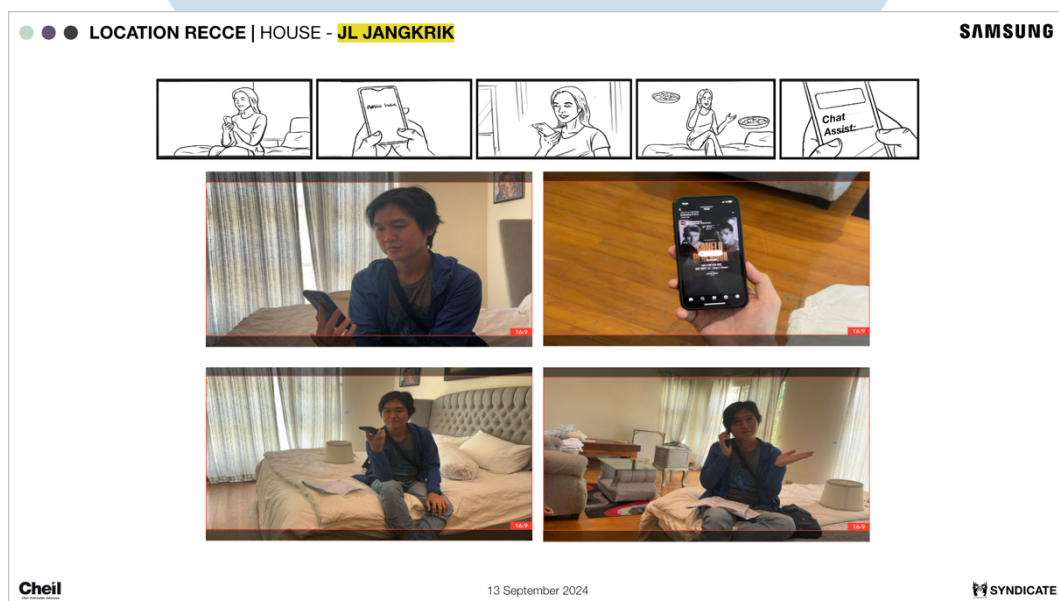
Gambar 3.4 Deck Hasil Recce

Pertama kami melakukan recce untuk story 1 , penulis datang ke kantor kemudian berangkat bersama dengan crew . Selama recce , penulis ditugaskan untuk foto lokasi dan membantu sebagai stand-in . Recce selesai tim kembali ke kantor untuk melakukan recap bersama dengan semua head of department . Setelah recap , tim produksi memasukkan hasil dari recce beserta melanjutkan revisi – revisi dari sebelumnya.