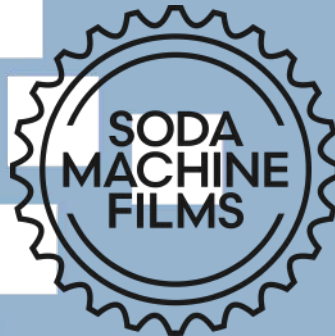
Gambar 2.1 Logo Soda Machine Films

PT. Sumber Rezeki Kreatif atau Soda Machine Films berdiri sejak 2013. Lucky Kuswandi, selaku pendiri dari Soda Machine Films membangun rumah produksi ini atas cita-citanya dalam menciptakan film berjudul “Selamat Pagi, Malam” yang mengharuskan adanya rumah produksi yang bekerjasama dengan Kepompong Gendut.