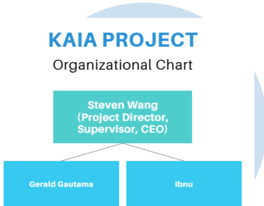
Gambar 2.2 Struktur organisasi agensi kreatif Kaia Project (dokumentasi pribadi)