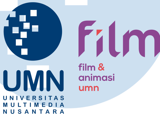
Gambar 2.1 Logo Universitas Multimedia Nusantara dan Prodi Film

Semua berawal dari berdirinya Universitas Multimedia Nusantara (UMN) pada tahun 2005 yang kemudian memulai bidang pendidikan pada tahun 2006 yang didirikan oleh Bapak Jakob Oetama, pemilik Kompas Gramedia.