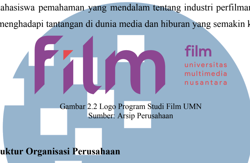
Gambar 2.2 Logo Program Studi Film UMN

penggabungan dua bidang yang saling berhubungan ini, UMN dapat memberikan para mahasiswa pemahaman yang mendalam tentang industri perfilman dan siap untuk menghadapi tantangan di dunia media dan hiburan yang semakin kompleks.