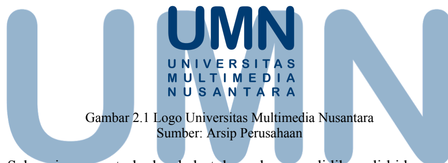
Gambar 2.1 Logo Universitas Multimedia Nusantara

UMN merupakan kampus di bawah naungan Kompas Gramedia Group yang didirikan pada tahun 2005 melalui Yayasan Multimedia Nusantara, Universitas Multimedia Nusantara berdiri sebagai upaya untuk memberikan pendidikan yang berkualitas terutama dalam bidang media dan teknologi. Pada awal berdirinya, UMN memiliki empat fakultas sebagai fondasi utama, yaitu fakultas seni dan desain, Fakultas, teknologi dan informasi, komunikasi, dan fakultas ekonomi. Fakultas-fakultas ini dirancang untuk meningkatkan kualitas pendidikan di era digital yang terus berkembang dengan memberikan mahasiswa pengetahuan dan keterampilan yang relevan untuk siap berada di industri.