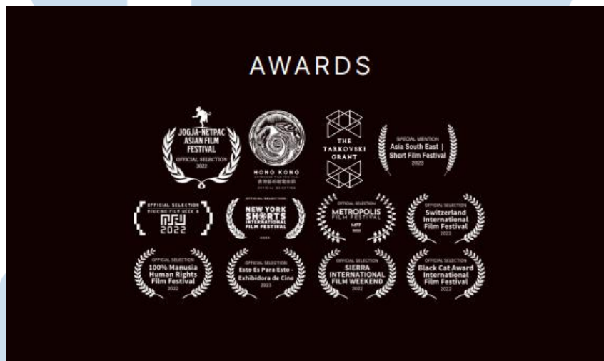
Gambar 2.3 Prestasi Syde Studio

Syde Studio yang terdiri dari sekelompok anak muda memiliki kekuatan yaitu dengan memberikan konten yang berdampak dan mempunyai gaya yang unik, menonjol, dan pembuatan cerita yang dekat juga menyentuh audiens. Adapun kekurangan Syde Studio adalah terbatasnya tenaga kerja karena masih terbilang baru. Strategi pemasaran yang kurang efektif juga menjadi faktor Syde Studio kurang dikenal dalam industri.