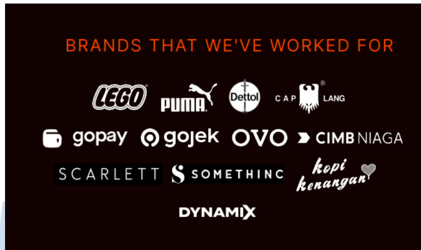
Gambar 2.2 Klien Syde Studio