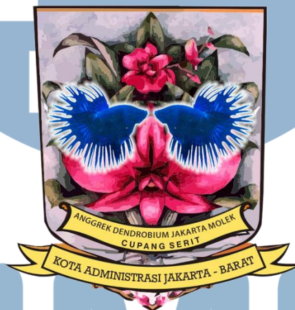
Gambar 2.1 Logo Administrasi Jakarta Barat

(@kotajakartabarat), Twitter (@kotajakbar), TikTok (@kotajakbar), Instagram (@kotajakartabarat) dan Youtube (@kotajakartabarat). Dan Walikota Jakarta Barat memiliki website resmi untuk menginformasikan kegiatan terkait Walikota Jakarta Barat, website tersebut dikelola oleh Sudin Kominfotik. Hal ini agar masyarakat Jakarta Barat bisa melihat berita terbaru terkait informasi kegiatan kantor Walikota dan daerah Jakarta Barat. Website Walikota Jakarta Barat bernama Pemprov DKI Jakarta. Website ini adalah Website resmi untuk berita Jakarta Barat dan Walikota Jakarta Barat. Walikota Jakarta Barat juga memiliki penghargaan yang didapatkan dari tahun 2023 hingga 2024. Penulis mendapatkan informasi tentang penghargaan yang didapatkan oleh Walikota Jakarta barat sebagai berikut.