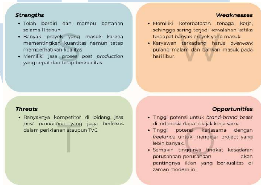
Gambar 2.2 Analisis SWOT Sunny Side Up Post Production

Sunny Side Up Post Production sebagai post production service juga pasti memiliki kelebihan maupun kekurangan, sehingga penulis membuat sebuah analisis berdasarkan strength , weakness , opportunities , dan threats (SWOT).