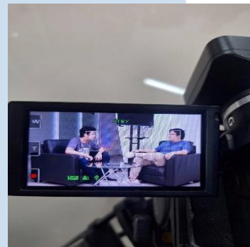
Gambar 3.2.2.2 Penulis membantu operasi kamera kedua saat dokumentasi sosialisasi MKBM.