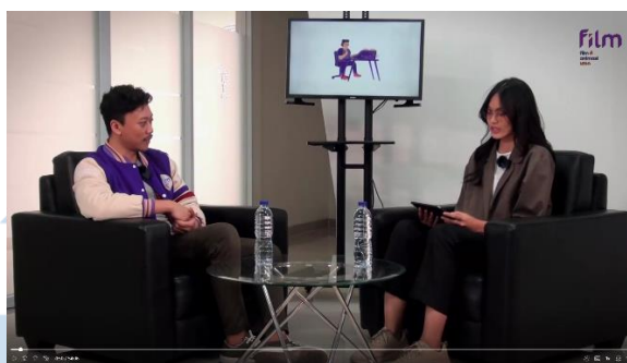
Gambar 3.2.1.2 Screenshot dari podcast PDF yang terbaru mengenai scriptwriting