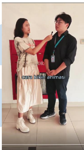
Gambar 3.2.1.1 Screenshot dari salah satu video wawancara sebagai contoh tipe video kedua.