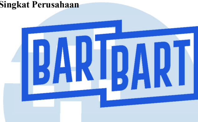
gambar 2.1. Logo perusahaan Bart Bart