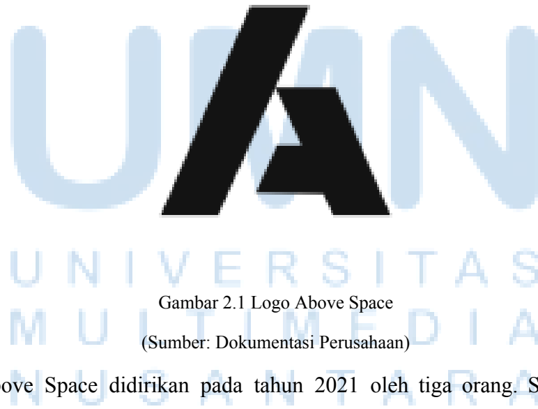
Gambar 2.1 Logo Above Space

Above Space adalah sebuah post-production house yang menawarkan berbagai layanan untuk iklan, video profil, video musik, dan film. Layanan yang tersedia mencakup berbagai aspek, seperti coloring , online editing , motion graphic , rotoscoping , dan compositing . Sejauh ini, Above Space telah mengerjakan sejumlah proyek iklan untuk klien-klien ternama, termasuk Tokopedia, Netflix, Extra Joss, Polytron, serta video musik dari berbagai artis dan banyak proyek lainnya.