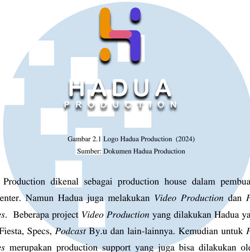
Gambar 2.1 Logo Hadua Production (2024)

Hadua Production dikenal sebagai production house dalam pembuatan video dokumenter. Namun Hadua juga melakukan Video Production dan Production Services . Beberapa project Video Production yang dilakukan Hadua yaitu Nivea, Sutra, Fiesta, Specs, Podcast By.u dan lain-lainnya. Kemudian untuk Production Services merupakan production support yang juga bisa dilakukan oleh Hadua, contohnya seperti project Tokopedia yang menjadikan Hadua sebagai Support Talent Manajemen.