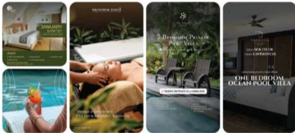
Gambar 2.3 Portofolio Hospitality AITI Media

Terdapat beberapa bisnis yang bergerak di bidang hospitality yang juga menjadi klien dari AITI Media, terutama di Bali. AITI Media berfokus untuk membantu mempromosikan bisnis-bisnis tersebut menggunakan teknik pemasaran terkini agar bisa meningkatkan penjualan dan juga pengunjung dari bisnis hospitality tersebut. Beberapa brand hospitality yang menjalin kerja sama dengan AITI Media yakni, De Ubud, Tlaga Singha, Prasana, Lasanti, Gending Kedis, Batam Marriott Hotel, dan lainnya.