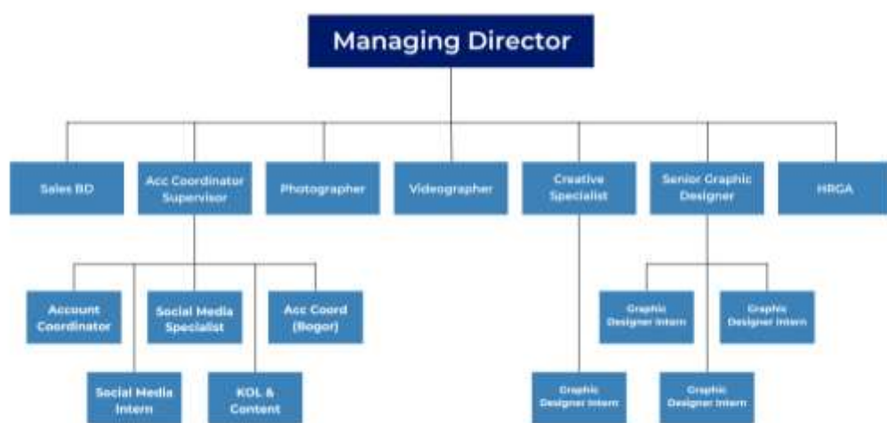
Gambar 2.1 Bagan Struktur Organisasi Perusahaan

CV AITI Solusi Kreatif telah mengimplementasikan struktur organisasi yang jelas dan terdefinisi. Meskipun AITI Media Bali dan AITI Media Jakarta memiliki struktur yang berbeda karena dipimpin oleh kepala cabang yang berbeda, pada pembahasan kali ini penulis akan menjelaskan struktur organisasi cabang Jakarta.