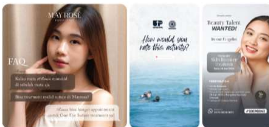
Gambar 2.4 Portofolio Services AITI Media

AITI Media memiliki beberapa partner bisnis yang bergerak di bidang services . Beberapa klien yang bergerak di bidang ini, diantaranya Upskill, Fangeline, May Rose, Gloria Production, Sunshine Preschool, dan lainnya.