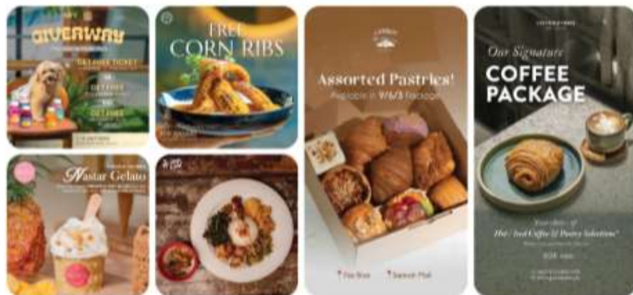
Gambar 2.2 Portofolio Food & Beverages AITI Media

Sebagian besar partner bisnis dari AITI Media merupakan bisnis yang bergerak di bidang food & beverages . Partner bisnis tersebut berlokasi di berbagai kota seperti Bali, Bogor, Jakarta, maupun Singapura. AITI Media berfokus untuk membantu mempromosikan bisnis-bisnis tersebut menggunakan teknik pemasaran terkini agar bisa meningkatkan penjualan dan juga pengunjung dari bisnis kuliner tersebut. Beberapa brand food & beverages yang menjalin kerja sama dengan AITI Media yakni, Livingstone Jakarta, Hog Wild, Hyde & Bite, Padhi, Miru, Yujo, Gelato Secrets, Cangu Bakehouse, dan masih banyak lagi.