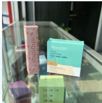
Gambar 2.7 Hasil Cetak CV. Indah Kencana untuk Brand Wardah

CV. Indah Kencana berperan dalam pelaksanaan proses pre-press atau pengolahan file dari klien, press atau produksi, dan post press atau finishing kemasan seperti laminasi dan pemotongan kemasan. Wardah telah bekerja sama dengan CV. Indah Kencana dalam pencetakan beberapa kemasan produknya seperti pada produk Instaperfect dan Luminous Two Way Cake .