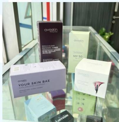
Gambar 2.9 Hasil Cetak CV. Indah Kencana untuk Brand Avoskin

Dalam pembuatan kemasan untuk Avoskin, CV. Indah Kencana bertanggung jawab dalam proses pengolahan file dari klien, pembuatan film dan pelat cetak, produksi dan mencetak kemasan, dan finishing kemasan seperti laminasi dan pemotongan kemasan. Avoskin mempercayai perusahaan CV. Indah Kencana dalam mencetak beberapa kemasan produknya seperti Your Skin Bae Serum , Intensive Divine Daycream , The Great Shiel Sun-essence , dan Miraculous Refining toner .