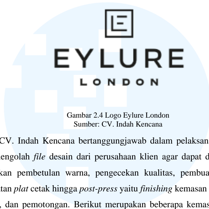
Gambar 2.4 Logo Eylure London

bintang film serta pencipta sebagian besar inovasi pada kategori bulu mata palsu seperti Double Lashes, C-lash, dan Faux Mink (Tim Eylure London, n. d)