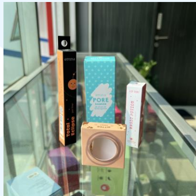
Gambar 2.11 Hasil Cetak CV. Indah Kencana untuk Brand Emina

CV. Indah Kencana berperan dalam pengecekan kualitas file , dan mengolah file sehingga file siap untuk dicetak, pembuatan film dan pelat cetak hingga percetakan dan sentuhan akhir yang meliputi pemotongan. Laminasi, pemotongan, embos, dan debos. Berikut adalah beberapa contoh hasil kemasan Emina yang dicetak oleh CV. Indah Kencana.