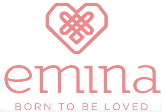
Gambar 2.10 Logo Emina

CV. Indah Kencana berperan dalam pengecekan kualitas file , dan mengolah file sehingga file siap untuk dicetak, pembuatan film dan pelat cetak hingga percetakan dan sentuhan akhir yang meliputi pemotongan. Laminasi, pemotongan, embos, dan debos. Berikut adalah beberapa contoh hasil kemasan Emina yang dicetak oleh CV. Indah Kencana.