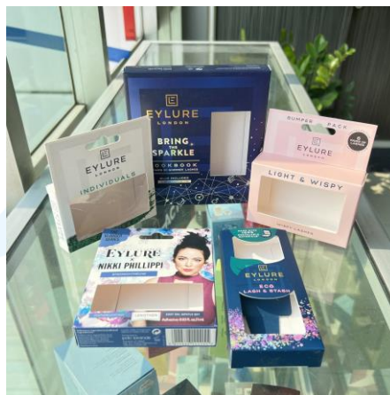
Gambar 2.5 Hasil Cetak CV. Indah Kencana untuk Brand Eylure London

CV. Indah Kencana bertanggungjawab dalam pelaksanaan pre-press , yaitu mengolah file desain dari perusahaan klien agar dapat dicetak dengan melakukan pembetulan warna, pengecekan kualitas, pembuatan film, dan pembuatan plat cetak hingga post-press yaitu finishing kemasan seperti embos, hot foil , dan pemotongan. Berikut merupakan beberapa kemasan yang telah dicetak oleh perusahaan CV. Indah Kencana untuk produk Eylure London.