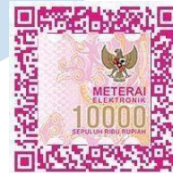
(Alvis Owen Tjokro)