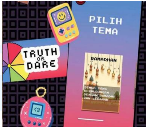
Gambar 2.5 Gameplay game Truth or Dare

Truth or Dare adalah game yang dibuat oleh Memento Game Studio untuk platform seluler, ini adalah versi seluler dari Truth or Dare dengan 3 game berdasarkan game Truth or dare yang sering dimainkan pada event social atau casual. Truth or Dare menggunakan seni bergaya Pixel sederhana dengan UI UX yang penuh warna dan memiliki tata letak yang relatif sederhana untuk dipahami. Truth or Dare adalah gim seru untuk meningkatkan ikatan Anda dengan sesama pemain dan mengungkap lebih banyak fakta tentang satu sama lain. Game Truth or dare dapat ditemukan pada platform Google play dan dapat diunduh menggunakan alat elektronik mobile .