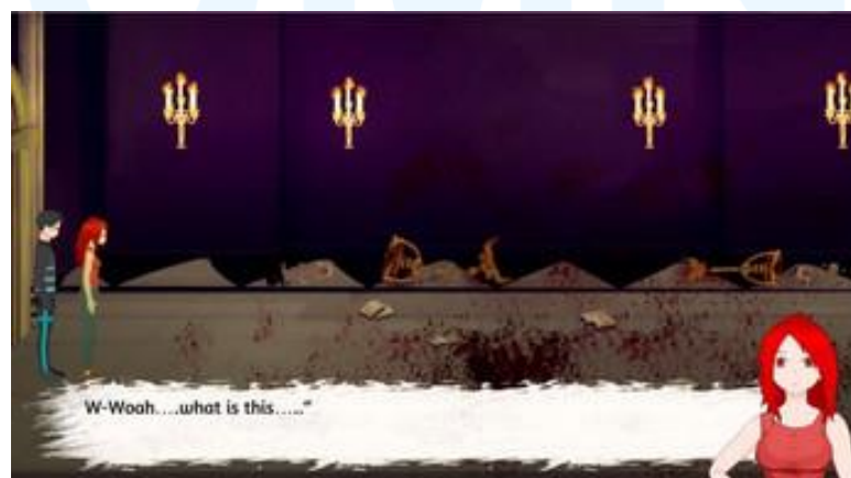
Gambar 2.3 Gameplay game Anomali