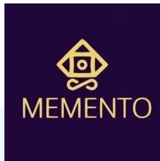
Gambar 2.1 Logo Perusahaan Memento Game Studio