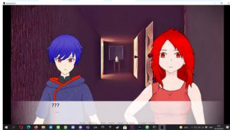
Gambar 2.4 Gameplay game AnonymoUS Sumber: Indira.p/ Dokumentasi Perusahaan (2024)

AnonymoUS adalah salah satu kreasi paling awal dari Memento Game Studio pada tahun 2021, AnonymoUS adalah game misteri novel Visual mengenai 5 karakter yang terjebak di sebuah kapal, salah satunya adalah Sera seorang detektif. Pemain harus mengungkap misteri dan pembunuhan, dan dengan memecahkan pembunuhan ini, pemain perlahan-lahan akan memengaruhi nasib penumpang. Dengan menyelesaikan pembunuhan ini dengan benar, pemain akan mencapai akhir yang optimal. AnonymoUS menggunakan gaya visual Jepang, seperti kebanyakan hasil karya Memento Game Studio.