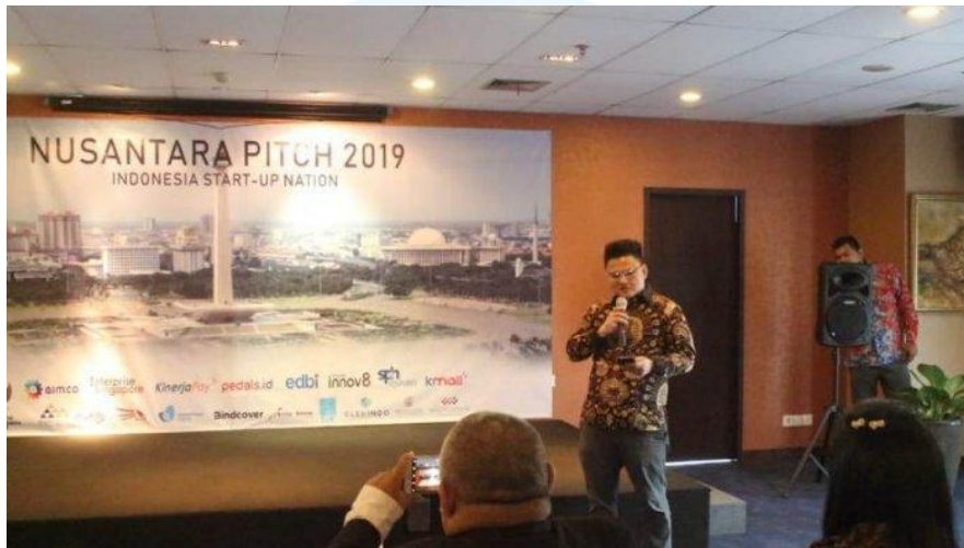
Gambar 2.5 Soft Launching di Jakarta

Demikianlah portofolio perusahaan yang ditampilkan. Portofolio-portofolio tersebut berfokus pada proyek kerja sama bisnis. Foto-foto yang ditampilkan merupakan dokumentasi pada saat acara berlangsung.