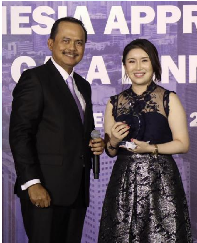
Gambar 2.4 Dokumentasi Penerimaan Penghargaan