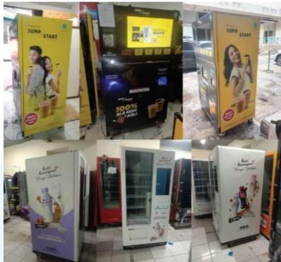
Gambar 2.4 Portfolio Printroom