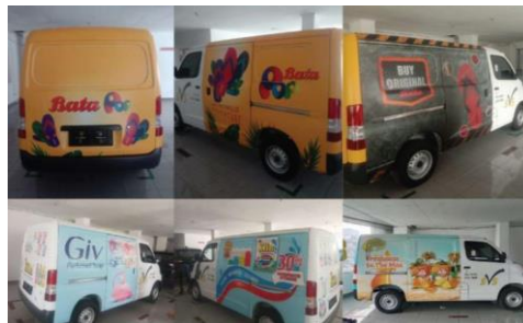
Gambar 2.5 Portfolio Printroom

Diatas merupakan stiker yang ditempelkan pada Vending Machine . Brand pada diatas merupakan Jump Start dan Kopi kenangan yang mana kedua perusahaan tersebut merupakan perusahaan yang terkenal. Kedua perusahaan tersebut mempercayakan kepada Printroom untuk menyetak serta memotong stiker yang digunakan untuk menempel pada Vending Machine tersebut. Stiker yang ditempelkan memiliki tujuan yaitu memberitahu bahwa pada Vending Machine tersebut menjual produk mereka sendiri.