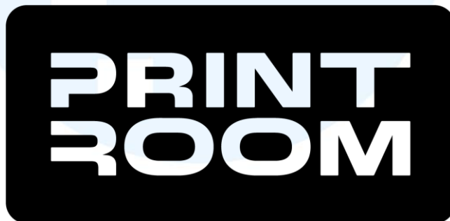
Gambar 2.1 Logo Printroom

PT Karya Grafika Digital (Printroom) merupakan salah satu perusahaan dalam bagian industri percetakan. Dengan visi dan misi yang cukup kuat dimiliki oleh perusahaan tersebut, perusahaan tersebut menawarkan jasa printing dimulai dari poster, spanduk, stiker, buku pada klien perusahaan besar. Berkat hasil yang sangat bagus, banyak perusahaan besar di Indonesia yang telah menggunakan jasa printing dari Printroom.