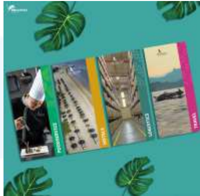
Gambar 2.4 Dokumentasi Hasil Karya Aerowisata

berupa dokumentasi foto, copywriting , dan layout yang membentuk karya-karya tersebut.