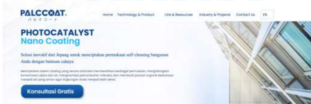
Gambar 2.5 Dokumentasi Website Palccoat

Palccoat merupakan sebuah brand sistem coating pembersih permukaan dengan cahaya. Peran Bekantan Creative dalam melakukan kerjasama bersama brand ini adalah membentuk website design dan development untuk brand tersebut. Palccoat merupakan brand asal Jepang, sehingga konsep dari hasil karya tersebut adalah menggunakan konsep minimalis dan mementingkan kemudahan pemahaman informasi kepada audiens.