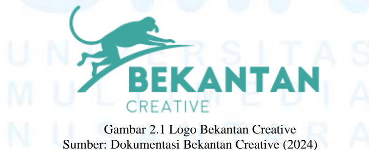
Gambar 2.1 Logo Bekantan Creative

Bekantan Creative merupakan sebuah agensi kreatif yang menyediakan layanan branding design , creative production , dan digital creation yang bergerak di bawah PT. Bekantan Rumah Produksi. Branding design mencakupi layanan yang berkaitan dengan memproduksi desain identitas, desain strategi, desain marketing kit , dan lainnya. Creative production berkaitan dengan produksi video, fotografi, dan animasi. Digital creation mencakupi layanan yang berkaitan dengan kebutuhan website , sosial media, desain e-commerce , dan lainnya. Layanan-layanan kreatif tersebut bertujuan untuk menyelesaikan masalah dan kebutuhan yang diperlukan oleh klien terkait branding , advertising , marketing , dan lainnya yang diproduksi oleh para pemuda kreatif dengan menawarkan solusi kreatif (Bekantan Creative, 2024).