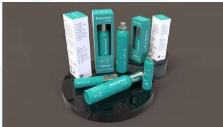
Gambar 2.3 Dokumentasi Kemasan NanomisT

NanomisT merupakan sebuah produk disinfektan penghilang bau, virus, dan bakteri. Peran Bekantan Creative dalam melakukan kerjasama bersama brand ini adalah membentuk brand identity , desain kemasan, dan graphic standard manual untuk brand tersebut. Proses produksi memakan rentang waktu selama 12 minggu. Proses yang dilewati dalam memproduksi brand identity dan kemasan adalah melakukan riset, brainstorming , menentukan look and feel dari brand , dan proses lainnya hingga membentuk hasil akhir yang sesuai dengan visi klien.