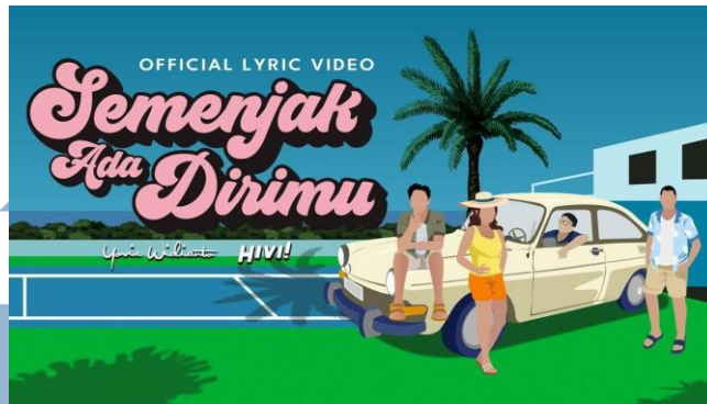
Gambar 2.5 Thumbnail Official Lyric Video “Semenjak Ada Dirimu”