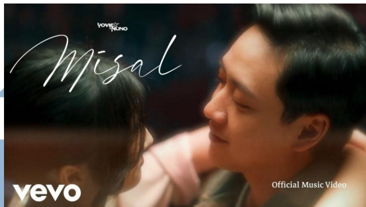
Gambar 2.6 Thumbnail Official Music Video "Misal"