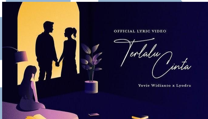
Gambar 2.4 Thumbnail Official Lyric Video “Terlalu Cinta”

banyaknya project yang telah dilakukan YWMF dalam mengembangkan banyak artis artis di Indonesia.