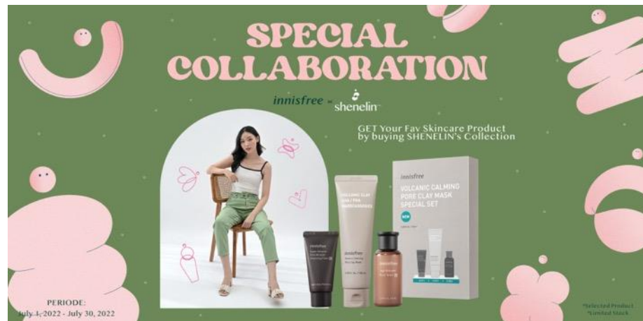
Gambar 2.3 Banner Kolaborasi Shenelin X Innisfree