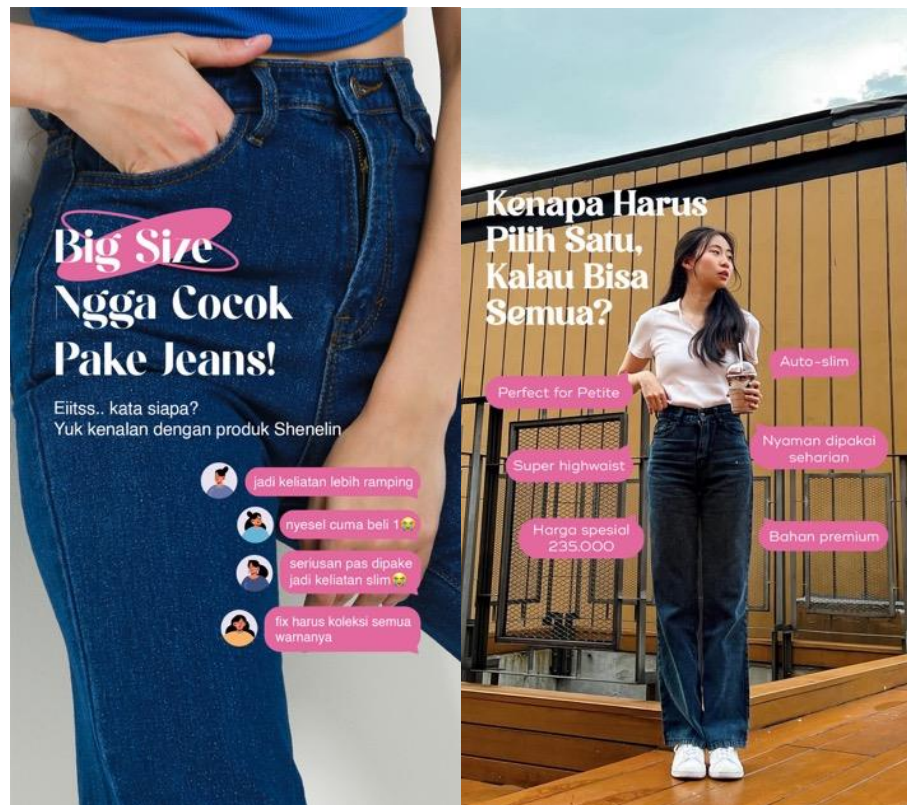
Gambar 2.6 Poster Feeds Instagram Produk Jeans Signature