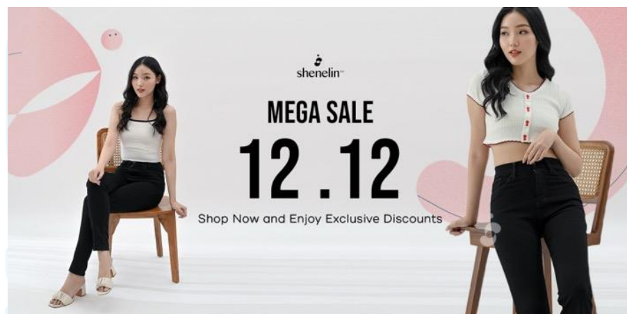
Gambar 2.4 Banner Promo 12.12 Shenelin

Setiap event tanggal kembar, Shenelin secara konsisten mengadakan promosi spesial dan memberikan potongan harga menarik bagi customer . Pada event 12.12 di tahun 2023, Shenelin menawarkan diskon untuk semua produk, sekaligus merayakan momen Natal. Banner ini didesain untuk meningkatkan antusiasme customer terhadap promo yang berlaku, dan mendorong penjualan secara signifikan selama periode liburan.