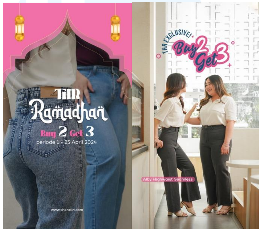
Gambar 2.5 Poster Story Promosi Spesial Ramadhan Shenelin

Pada April 2024, Shenelin meluncurkan promo spesial Ramadhan bertajuk "Buy 2 Get 3." Promo ini didesain dengan secara menarik dalam bentuk Instagram Story, yang dirancang oleh tim desainer grafis Shenelin. Tujuannya untuk meningkatkan interaksi dan menarik minat pelanggan selama momen Ramadhan.