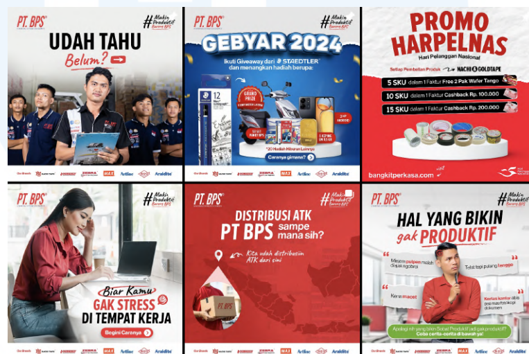
Gambar 2. 7 Klien Dreambox, PT BPS

PT Bangkit Perkasa merupakan distributor alat tulis terbaik di Indonesia yang memiliki produk besar seperti Zebra, Staedtler, Artline dan lain sebagainya. Hal yang ingin ditingkatkan oleh PT Bangkit Perkasa adalah awareness masyarakat serta pemilik perusahaan mengenai PT Bangkit Perkasa sebagai distributor alat tulis yang bisa membantu perusahaan untuk keperluan alat-alat kantor dengan jangkauan harga yang lebih baik dari harga pasar pada umumnya.