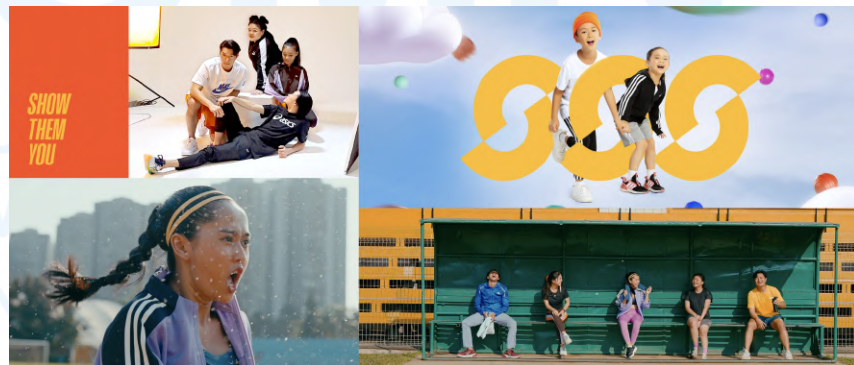
Gambar 2. 5 Klien Dreambox, Triple S

Sun and Sand Sports (Triple S) merupakan brand yang menjual pakaian olahraga dari Uni Emirat Arab. Di tahun 2023, Sun and Sand Sports membuka toko terbaru di Indonesia yang terletak di Pondok Indah Mall 3.