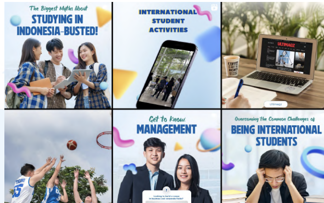
Gambar 2. 4 Klien Dreambox, Universitas Multimedia Nusantara

multimedia yang berada dibawah naungan Kompas Gramedia yang tersedia dengan 2 jenjang pendidikan yaitu Strata 1 dan Strata 2.