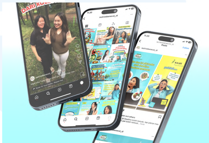
Gambar 2. 6 Klien Dreambox, Nutrive Benecol

Nutrive Benecol merupakan brand minuman yang memiliki khasiat untuk menurunkan kolesterol tinggi. Distribusi minuman Nutrive Benecol beredar di segala minimarket serta supermarket yang ada di Indonesia.